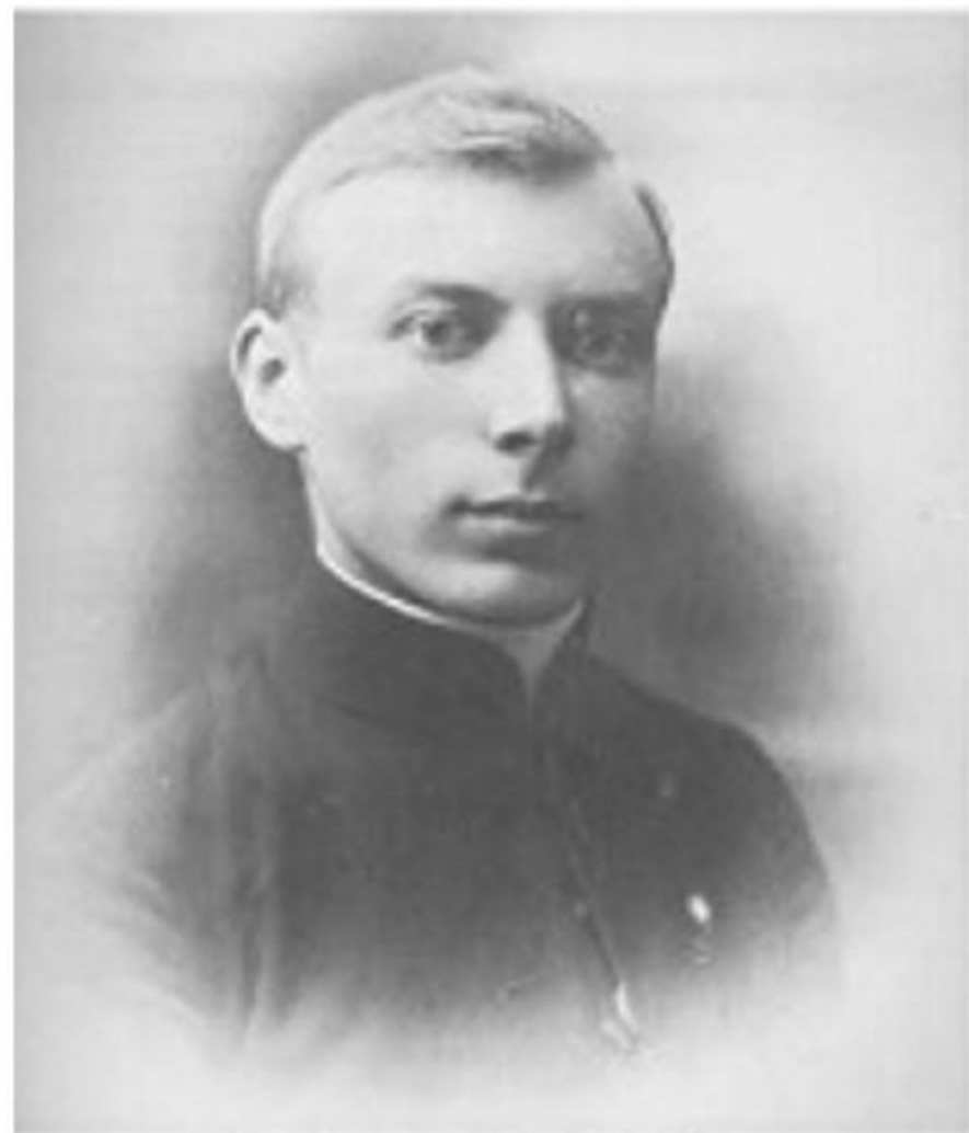
Jako młody kapłan

1924 został wikariuszem we włocławskiej parafii katedralnej oraz m.in. redaktorem dziennika diecezjalnego „Słowo Kujawskie” (1924–1925).