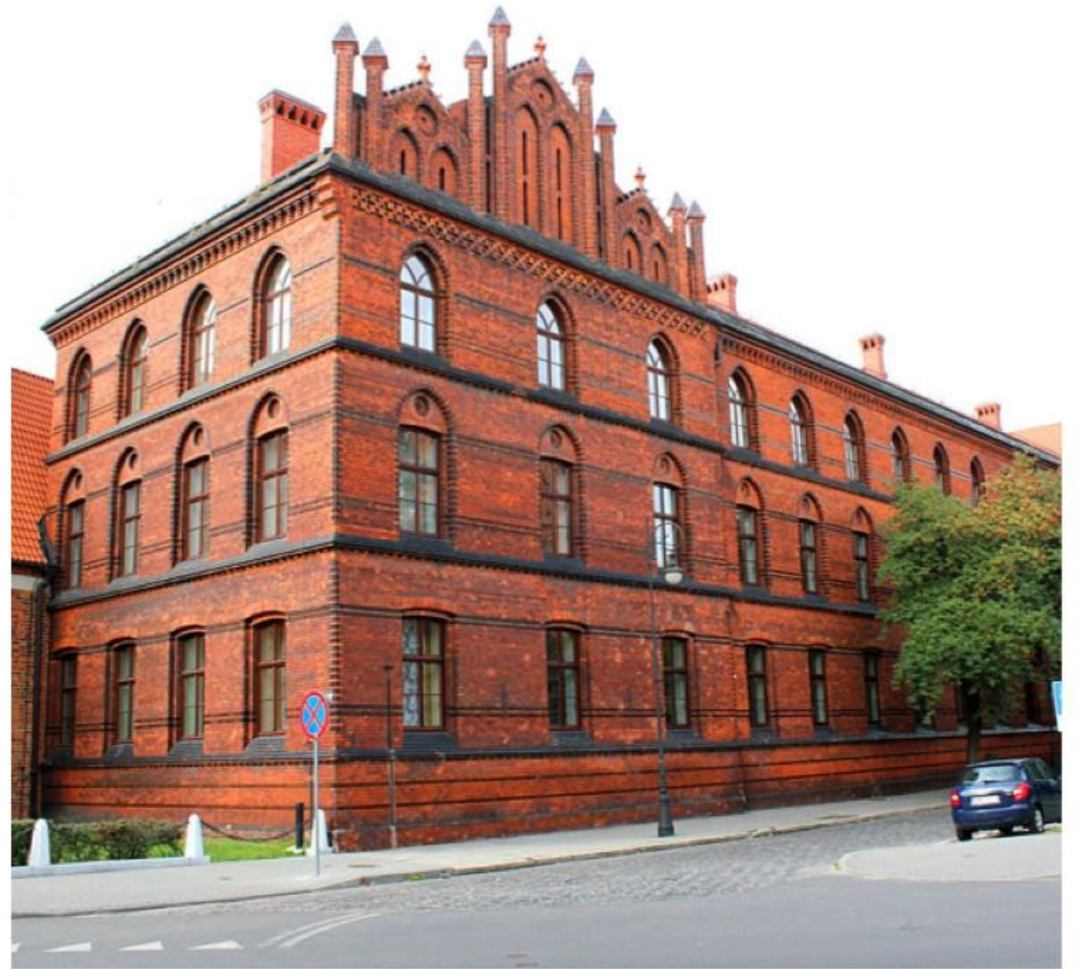
Wyższe Seminarium Duchowne we Włocławku

W latach 1920-1924 był klerykiem Wyższego Seminarium Duchownego we Włocławku. Święcenia kapłańskie przyjął 3 sierpnia 1924 (w dniu swoich 23. urodzin) w kaplicy Matki Bożej we włocławskiej bazylice katedralnej z rąk biskupa Wojciecha Owczarka.