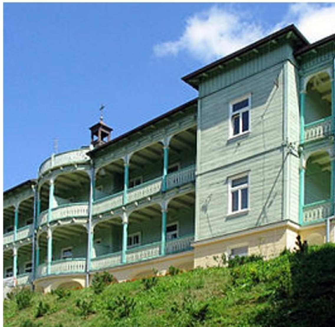
Klasztor Nazaratanek w Komańczy